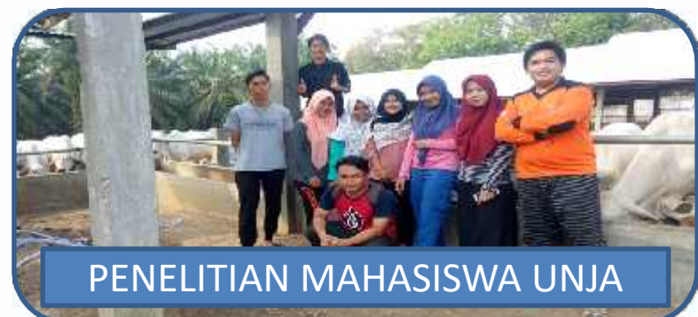
PENELITIAN MAHASISWA UNJA