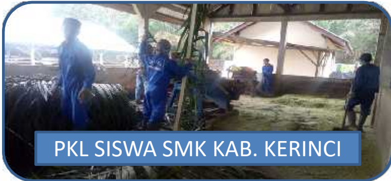
PKL SISWA SMK KAB. KERINCI