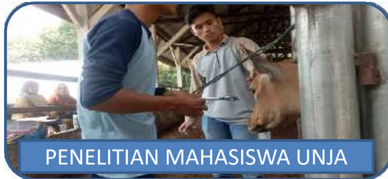
PENELITIAN MAHASISWA UNJA