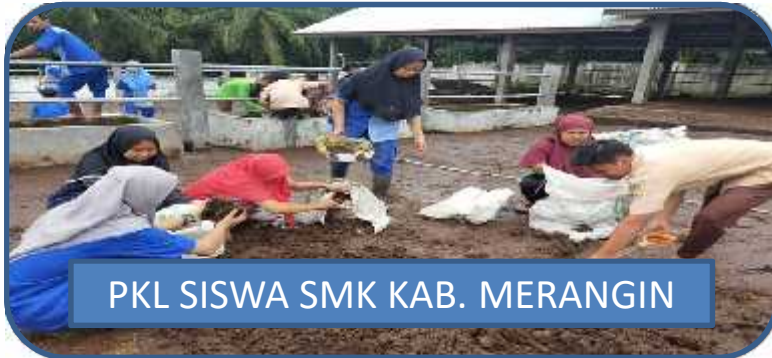
PKL SISWA SMK KAB. MERANGIN