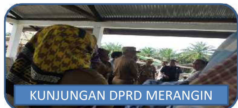
KUNJUNGAN DPRD MERANGIN