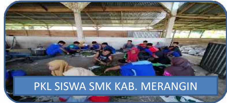
PKL SISWA SMK KAB. MERANGIN