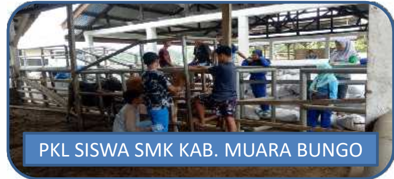
PKL SISWA SMK KAB. MUARA BUNGO