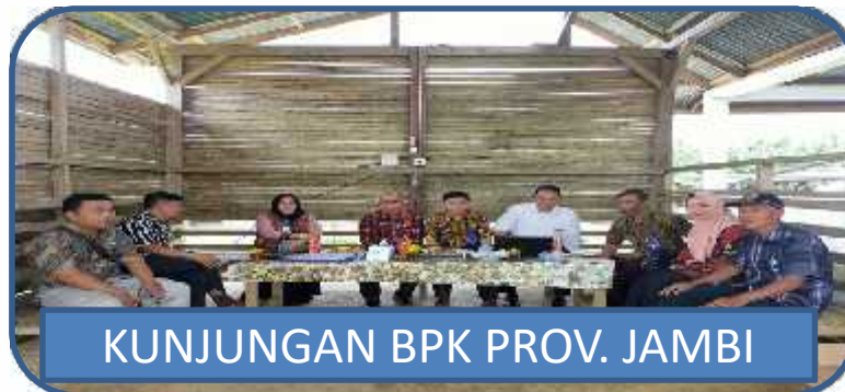
KUNJUNGAN BPK PROV. JAMBI